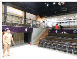
関大と関学の相撲部の学生さんがスタッフとして来ていた