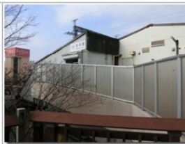
古墳群があちこちに