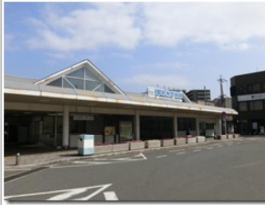
メインでは無い方なのが 開放としていた