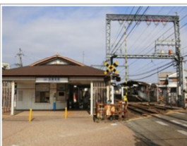
休日の昼間は1時間に2本