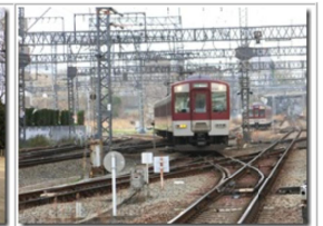
長野線とのジャンクション