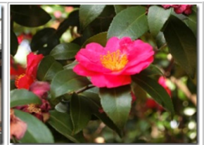
椿の花はおわりごろ

ここもミッション駅で『虎につばさカード』を購入。周辺には古墳がたくさんあるが、けっこう距離があるので、近くの白鳥神社に参詣。その後、長野線が分岐する駅南側の踏切で列車の撮影した。