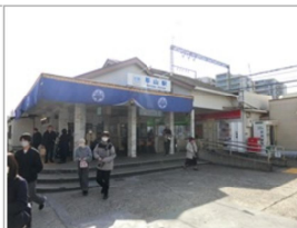
さすがに賑わっている