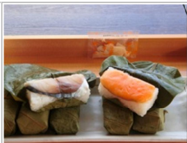
出来たてなのか柔らか