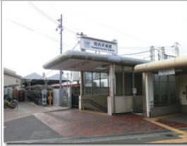
近くに阪南大学がある