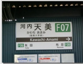
大阪阿部野橋駅から各駅停車で6駅