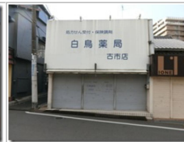
近くには白鳥神社がある