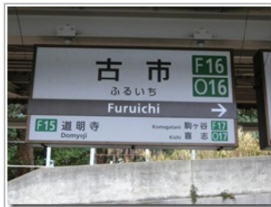
準急に乗り換えて古市駅へ