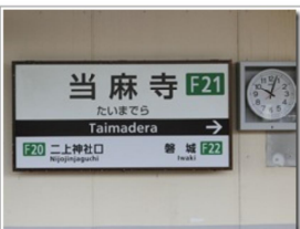
大阪・奈良の県境を越え5駅