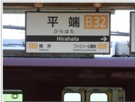
筒井順慶の墓所がある