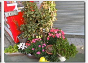
春っぽくなってきた

『ひのとりカード』を使ったにもかかわらず…けっきょく各駅停車に乗って6駅、まだまだ下町感の残る河内天美駅に到着。この駅はミッション駅でミッション成功、『しまかぜカード』を購入した。その後で駅周辺をさくっと回って、すぐに次へ。サイコロの目は6。各停に乗り、河内松原駅で準急に乗り換えて古市駅へ。