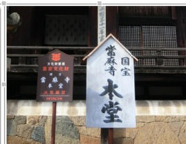
駅名の由来である当麻寺へ