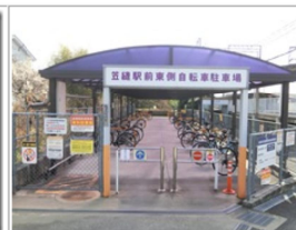
周囲は畑の住宅だけで 駅名さがしに苦労した