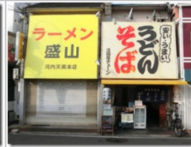
ラーメン盛山は河内天美が本店らしいぞ(支店は?)