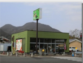
柿の葉寿司ヤマト当麻店