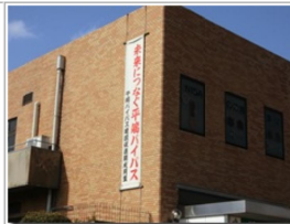
保険のつもりで撮影したがこれしか見つからなかった