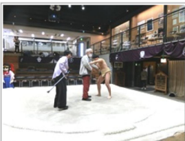
実寸大の土俵に上がれる